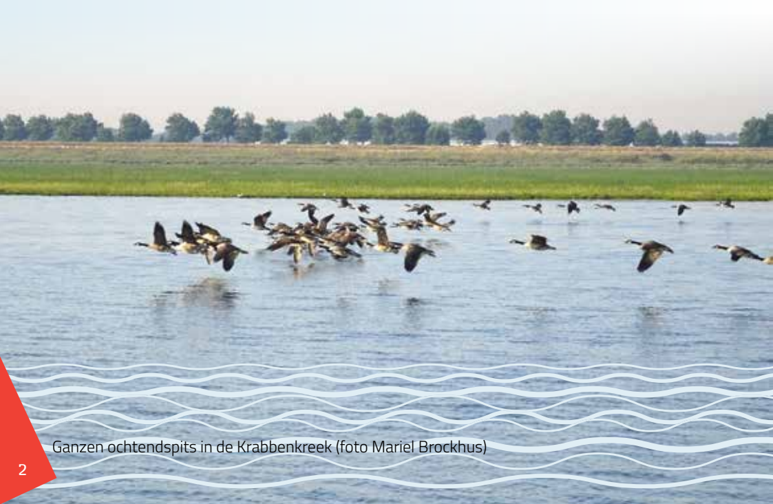
Ganzen ochtendspits in de Krabbenkreek