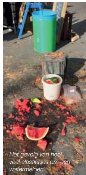
Het gevolg van heel veel elastiekjes om een watermeloen