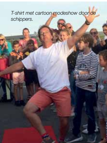
T-shirt met cartoon modeshow door de schippers.