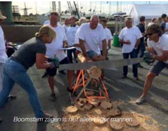
Boomstam zagen is niet alleen voor mannen.