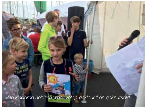
De kinderen hebben weer volop gekleurd en geknutseld.