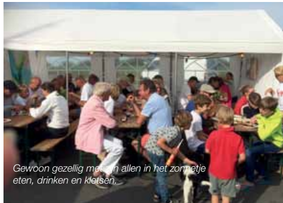
Gewoon gezellig met en allen in het zonnetje eten, drinken en kletsen.