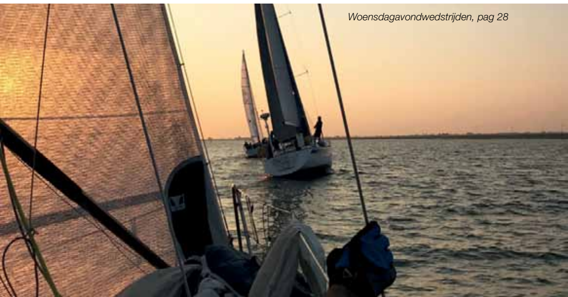
Woensdagavondwedstrijden, pag 28