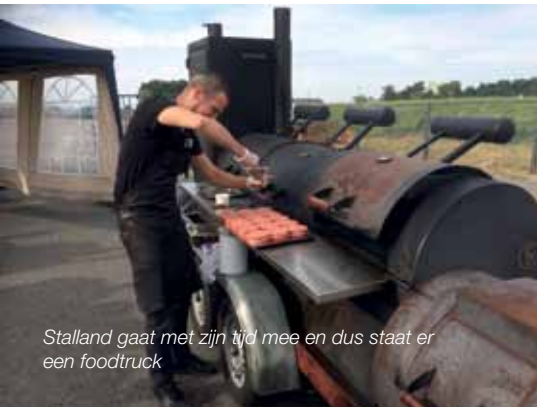
Stalland gaat met zijn tijd mee en dus staat er een foodtruck