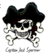
Captain Jack Sparrow