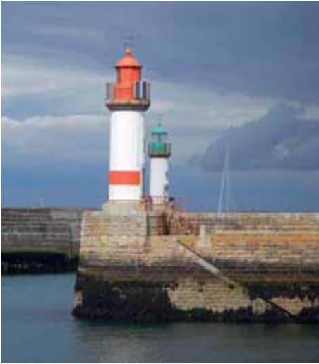
Ile de Groix havenhoofden

dinsdag ging Merrymate op pad en wel naar het zuiden! Op weg naar marktjes, oesters en croissants! De tocht naar het zuiden ging voorspoedig: Breskens, Boulogne, Cherbourg. Toen werd de vraag: waarheen nu? Kanaaleilanden of toch verder?