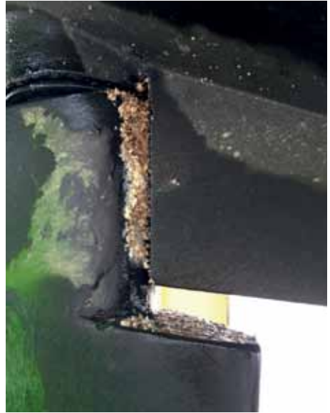
Vele schelpjes en pokken op het roer.

discussie kan worden, is de wet- en regelgeving in Nederland zo langzamerhand niet te ver door geschoten? Gaan we niet te ver met onze milieueisen?