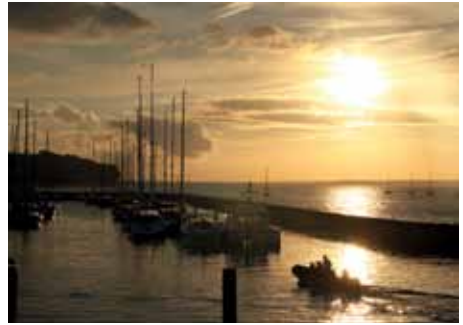
Zonsondergang in Yarmouth