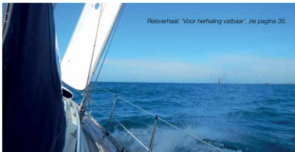
Reisverhaal: 'Voor herhaling vatbaar', zie pagina 35.