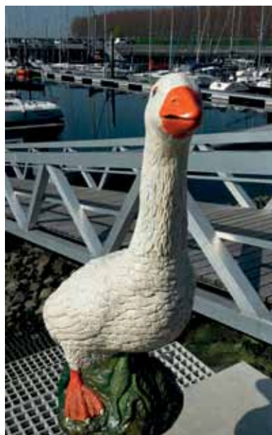
Gijs in full color