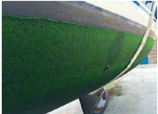
Tot een meter onder de waterlijn aangroei

Drie weken later zijn we in Medemblik, boot uit het water en toen de verbazing. Niet een beetje aangroei, nee het hele onderwaterschip was begroeid met een dikke laag algen. Bij de roerkoning veel schelpjes en pokken. In eerste instantie denk je “ze zijn gewoon de antifouling laag vergeten”. Maar nee, de experts waren duidelijk, er zit wel degelijk een laag antifouling op. Gelukkig ging het verwijderen van de alg aangroei redelijk