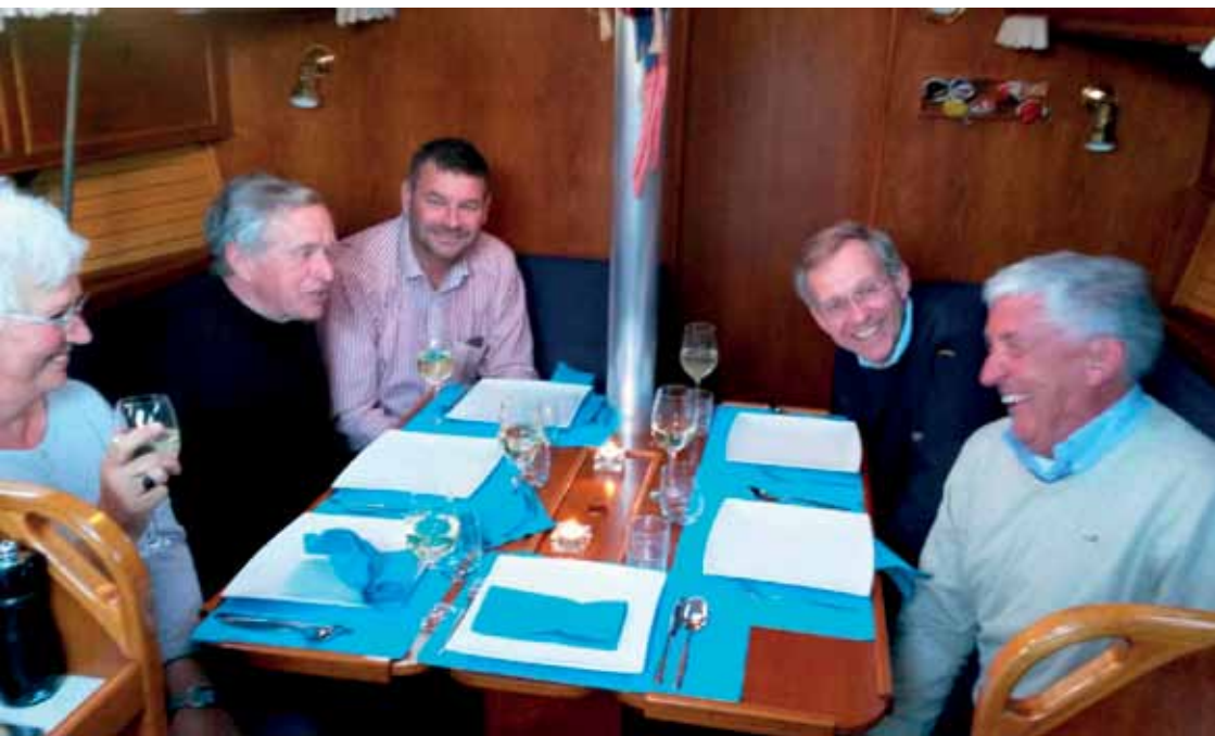
Mooie tafel