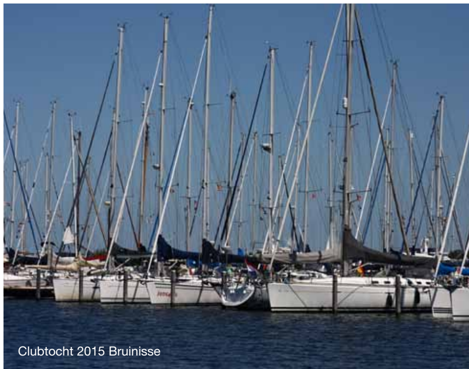
Clubtocht 2015 Bruinisse